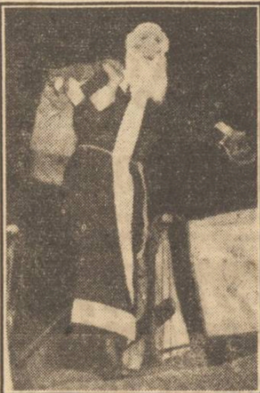
Moș Crăciun, văzut de copii...

— „Da, dragă, mă duc să petrec sărbătorile la tinerii însurați, cari au fost astăvără la noi. Băgați de seamă să nu trîncăniți ceva să aște stăpînul. Mă întorc Marți după ce trece primăria Crăciunului.